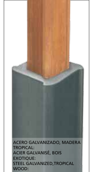
ACERO GALVANIZADO, MADERA TROPICAL; ACIER GALVANISÉ, BOIS EXOTIQUE; STEEL GALVANIZED, TROPICAL WOOD:

Otras luminarias / Autres luminaires Other luminaires