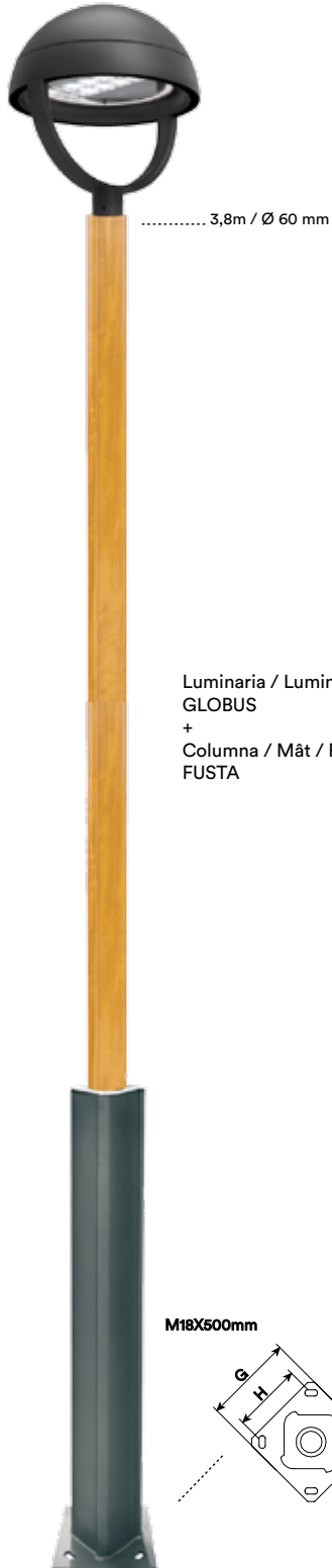
Luminaria / Luminaire / Luminaire GLOBUS + Columna / Mât / Pole FUSTA

Base fabricada en acero S-235-JR galvanizado. Acabados superficiales mediante revestimiento de poliuretano texturado en forja. Fuste de madera tropical tratada con protector fungicida, insecticida e hidrófugo. Reforzado interiormente con tubo cuadrado de acero galvanizado de 60mm. Espesor (base, fuste): 4mm. *Brazo galvanizado acabado color negro microtexturado.